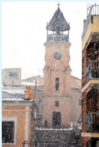
Fotografía de portada:

2 3 4 6 8 9 10 11 12 13 14 16 17 18 19 20 21 22 24