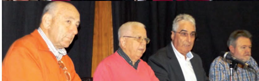
Asamblea de Jubicam