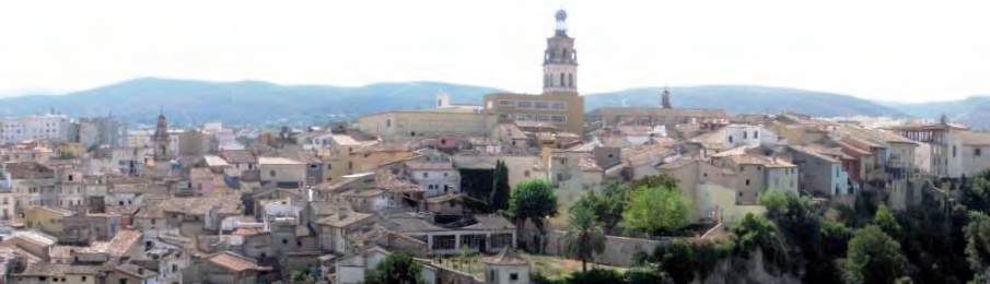
Vista panorámica de Ontenient

Solo me queda añadir que nos dimos un garbeo por la Feria Gastronómica y que comimos, bastante bien, ya no sé si en la cocina de un restaurante o en un restaurante llamado La Cocina. Después del vino que tomé no recuerdo muy bien. Al regresar condujo otro.