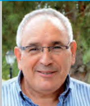
Juan Carlos Navarro Albert