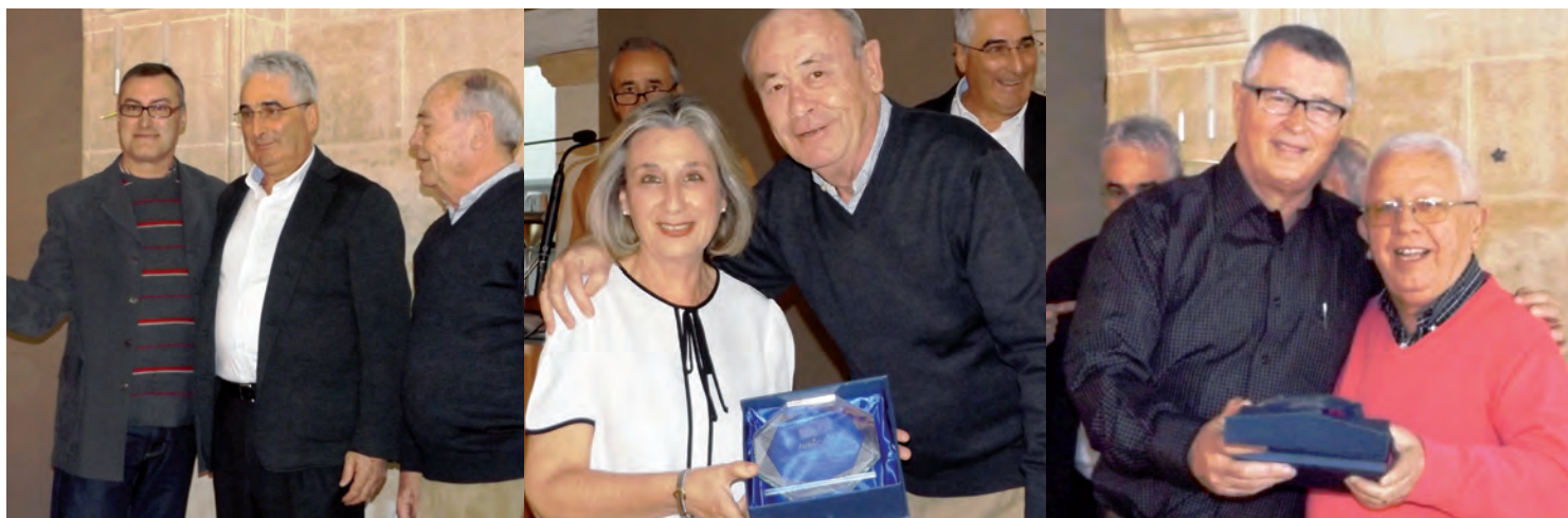
Entrega de premios del Concurso de Fotografía

El diario electrónico local XABIA.COM recoge una amplia crónica de la jornada, que podéis encontrar en: http://www.javea.com/los-jubilados-la-cam-jubicam-celebran-asamblea-anual-xabia/