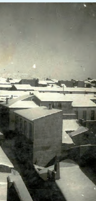
Año 1942. Desde el campanario de la Iglesia de Pinoso